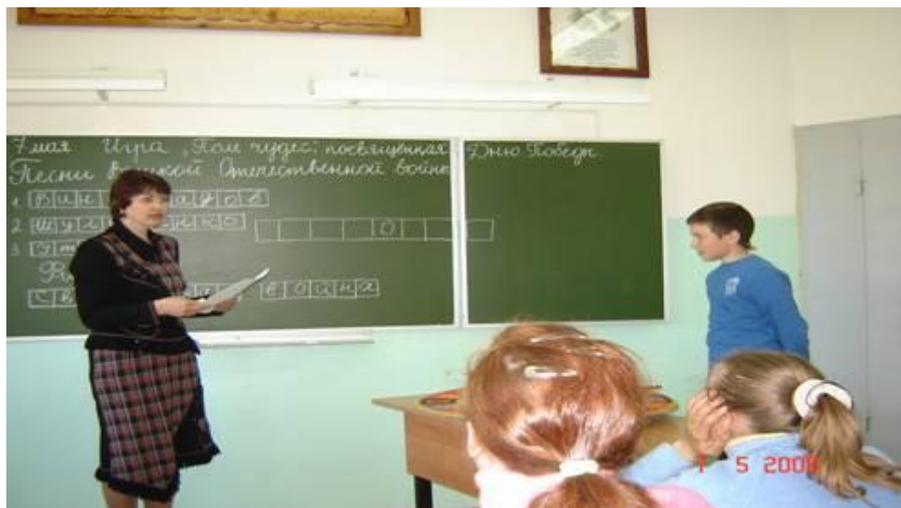
Песни Великой Отечественной войны. Игра «Поле чудес», посвящённая Дню Победы.