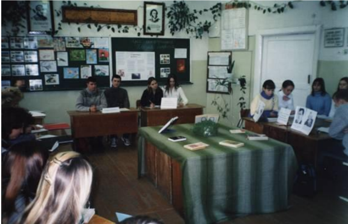
Пресс-конференция «Поэзия подвига»