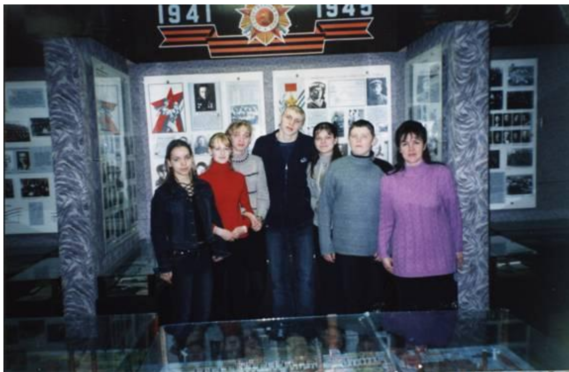
Посещение музея комбината АО «Навтекс»